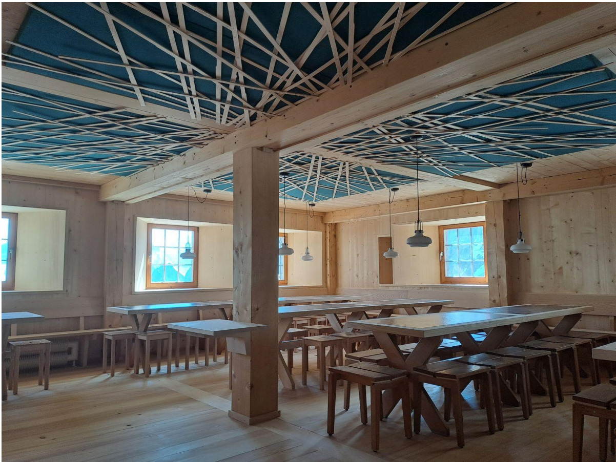
Text und Bilder: Alois Wyss